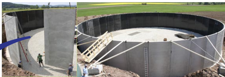
▲ Behälter aus Fertigteilen mit 36 m Durchmesser